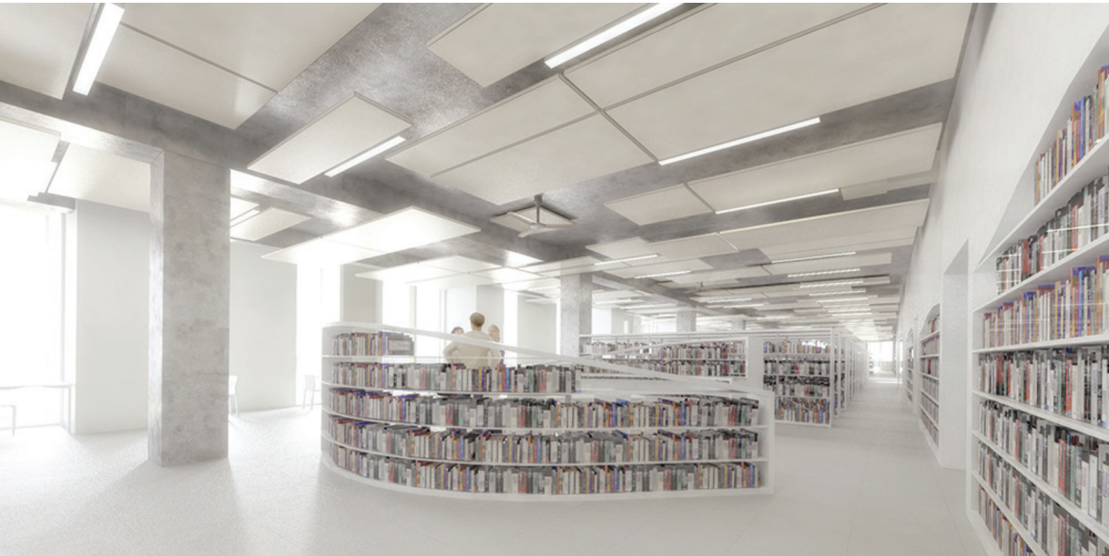
Salle de lecture du Grand équipement documentaire © Elizabeth de Portzamparc, Région Ile-de-France

Au printemps dernier, le Grand équipement documentaire (GED) a été sélectionné pour faire partie des neuf bibliothèques délégataires du groupement d'intérêt scientifique (Gis) CollEx-Persée, initié par le Ministère, sur la thématique Sociétés et populations : démographie, sociologie et histoire sociale.